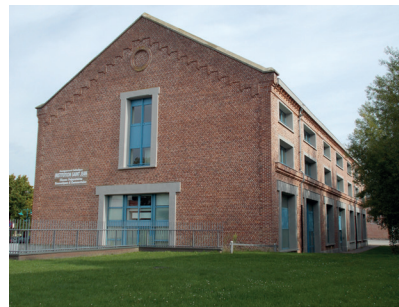
Bâtiment de l'Arsenal - Saint Jean