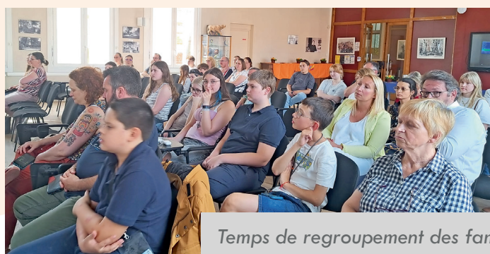
Temps de regroupement des familles pour clôturer l'année.