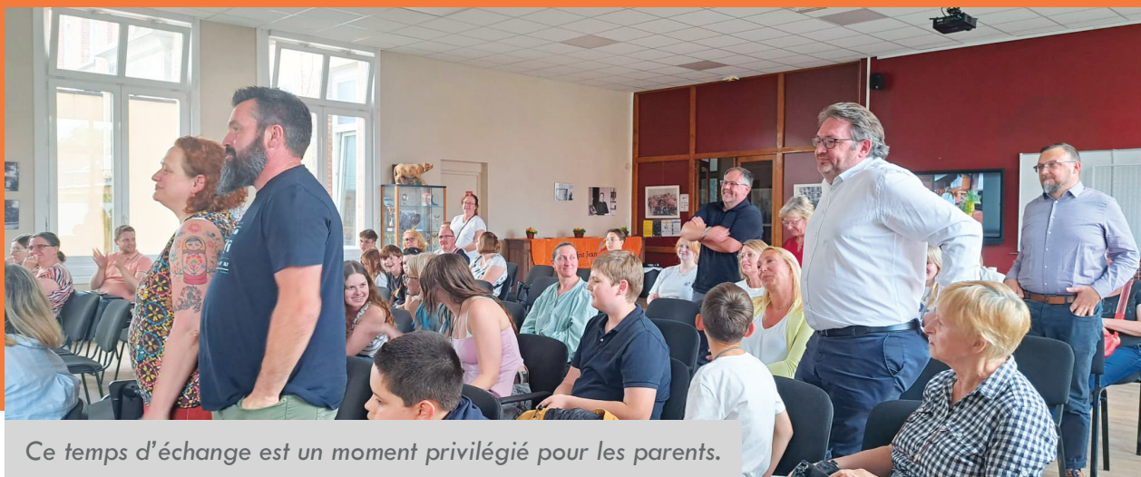
Ce temps d'échange est un moment privilégié pour les parents.