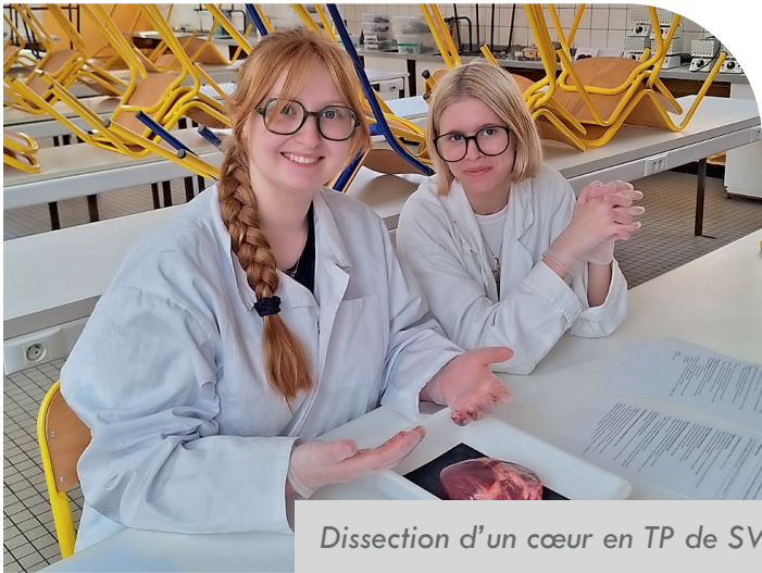
Dissection d'un cœur en TP de SVT.