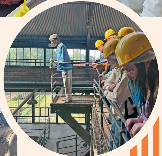
Visite du musée de la mine à Lewarde.