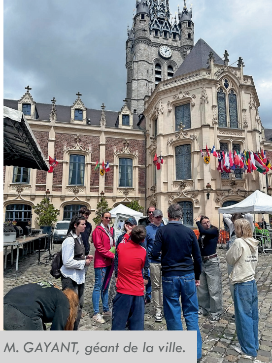
Visite de Douai et découverte de M. GAYANT, géant de la ville.