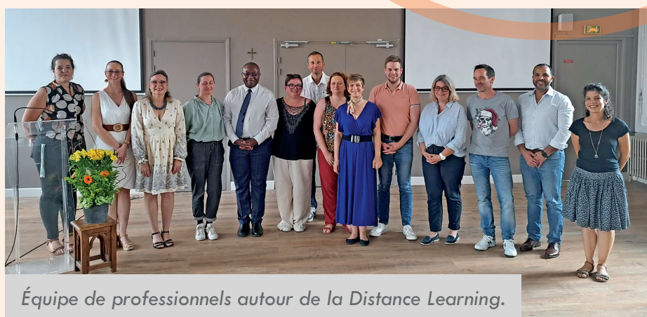
Équipe de professionnels autour de la Distance Learning.