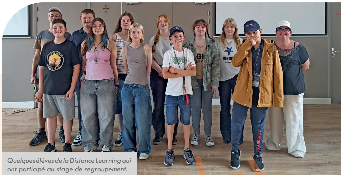
Quelques élèves de la Distance Learning qui ont participé au stage de regroupement.