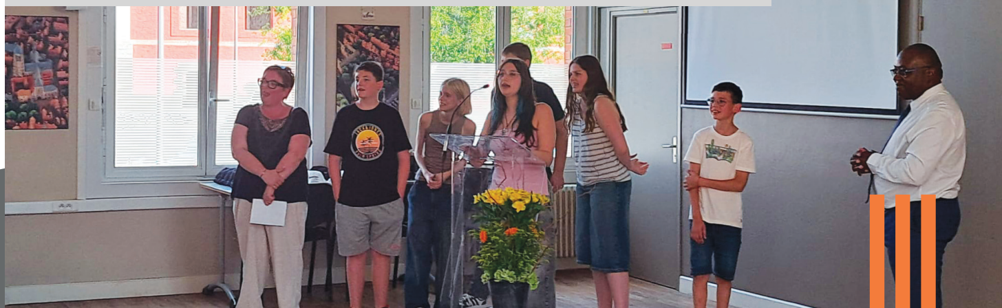
Les témoignages des élèves devant l'assemblée sont des instants précieux et émouvants.

Grâce à vous, des élèves en difficulté peuvent reprendre les cours dans un cadre adapté, et c'est formidable. »