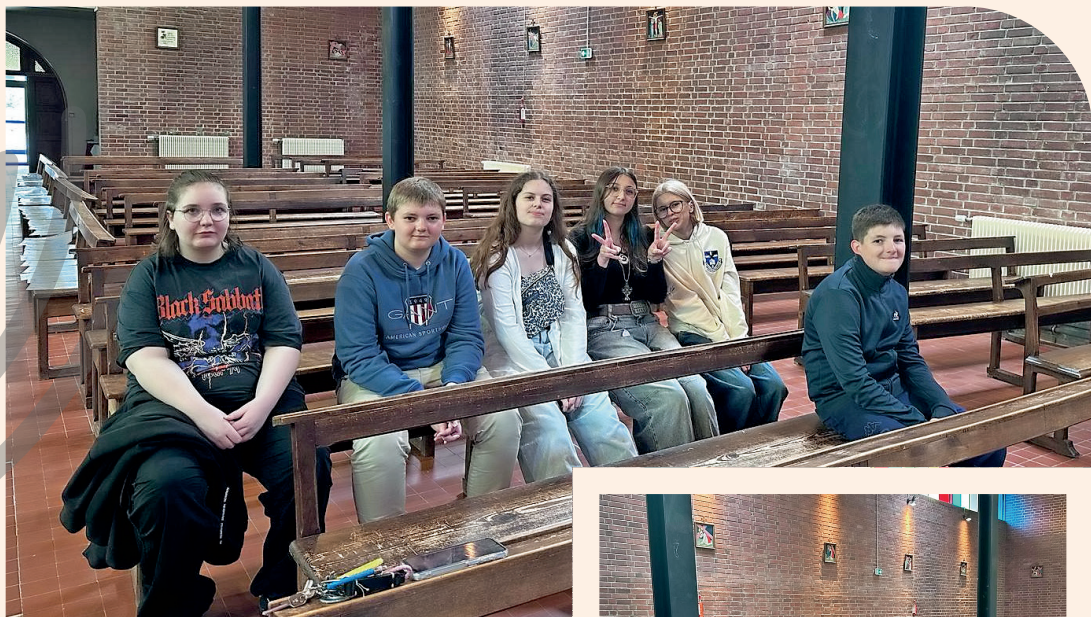
Temps spirituel à la chapelle de Saint Jean.